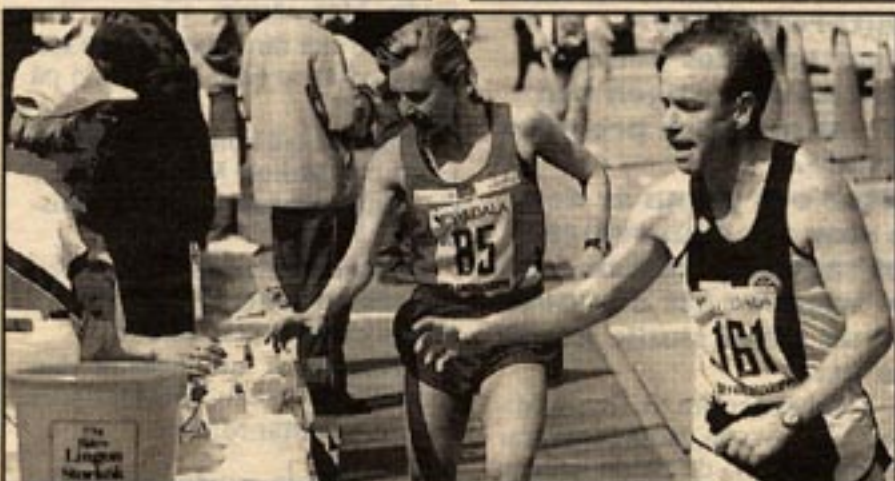
Va faaan! Nummer 161 svor så det osade över nejden när han blev blåst på vattnet. Och han var inte den ende som famlade i luften efter den begärliga drycken vid vätskekontrollen i Lindome.