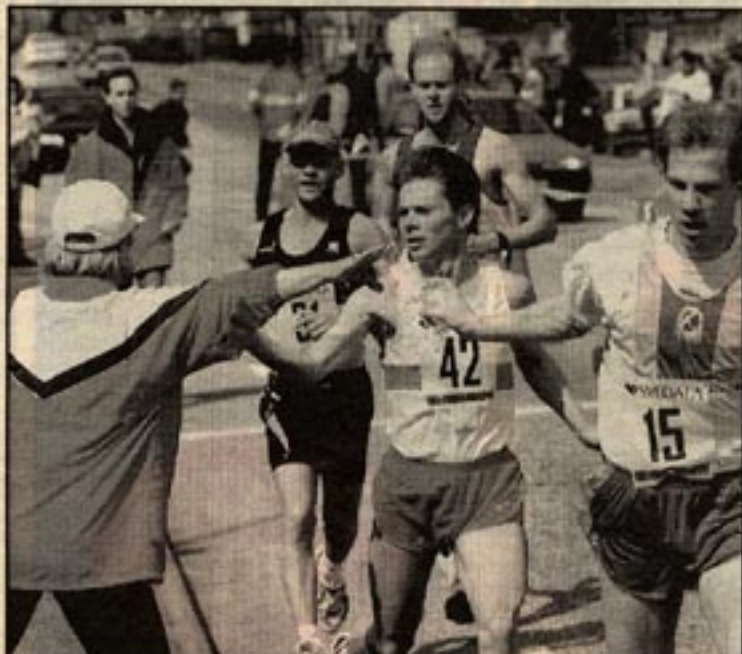
At det hållet ska ni springa, signalerar ensam damen vid vattenhållet. Hon klarar bara två muggar åt gången och är chanslös när löparna kommer många på en gång.